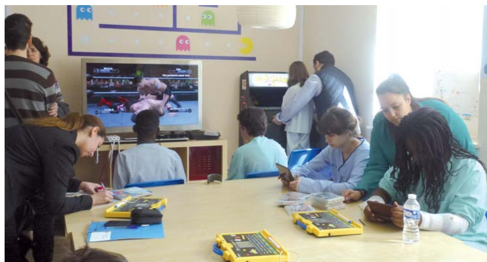
↑ Sala multimedia creada por la Fundación Juegaterapia.

Por otra parte, la Fundación Juegaterapia, junto al grupo AGA Editores, ha hecho posible que una parte de las consultas pediátricas cuente