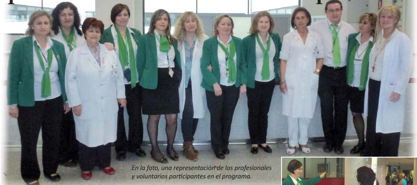
En la foto, una representación de los profesionales y voluntarios participantes en el programa.

El Servicio de Información y Atención al Paciente del Hospital ha implantado el Programa de Acompañamiento a Pacientes Ambulantes con Discapacidad –Servicio APAD– que tiene como objetivo facilitar que estas personas acudan a las consultas, así como recibir información o realizar trámites administrativos derivados de la atención recibida, siempre que no puedan ser acompañados por un familiar o allegado el día de la cita.