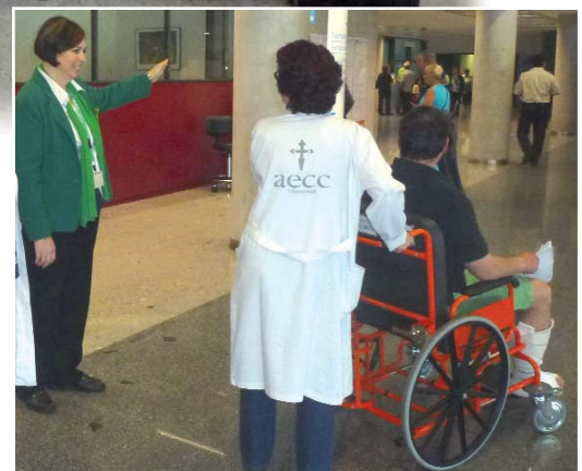
Un voluntario sigue las indicaciones de un profesional de información en un acompañamiento.

El Programa de Acompañamiento a Pacientes Ambulantes con Discapacidad es una iniciativa de la Dirección General de Atención al Paciente de la Consejería de Sanidad, al que se están incorporando progresivamente los hospitales públicos de la