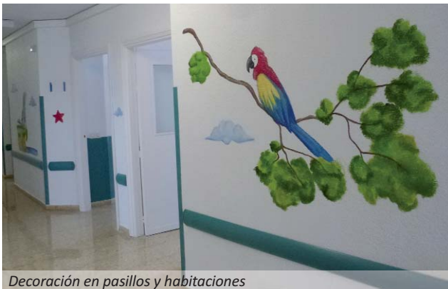
Decoración en pasillos y habitaciones