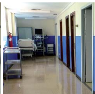
Reforma de los pasillos de los quirófanos de la planta 3ª