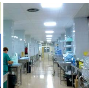
Sustitución de los techos en Esterilización