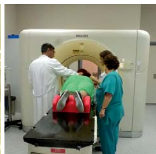
TAC simulador de Oncología Radioterápica