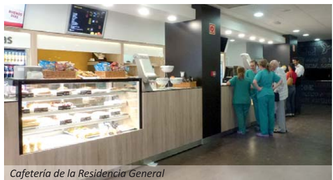
Cafetería de la Residencia General

Asimismo ha supuesto la unificación de los puestos de enfermería en uno solo situado en el centro de la Unidad, incremento en el número de lavabos para los profesionales, al objeto de reducir la infección nosocomial; cambio de los cabeceros de las camas que incorporan un sistema informático para un control más eficiente del paciente, y reforma de las zonas de sucio, limpio y almacenamiento, así como la entrada de acceso para los profesionales.