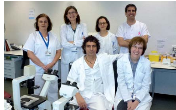
Profesionales del Servicio de Inmunología.

De los tres hospitales de la Comunidad de Madrid que prestan servicio de histocompatibilidad al trasplante de órganos – Ramón y Cajal, Puerta de Hierro-Majadahonda y 12 de Octubre–, nuestro Centro es el único que ha recibido esta acreditación