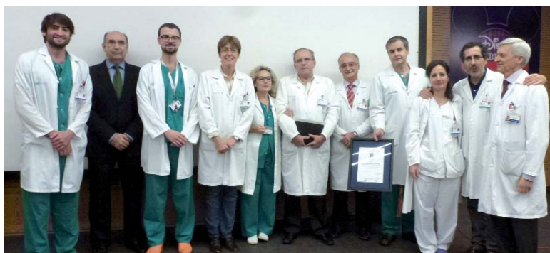
Trasplante Microquirúrgico para Reconstrucción de Cabeza y Cuello del Servicio de Cirugía Maxilofacial