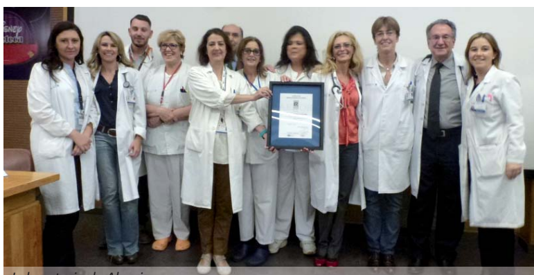
Laboratorio de Alergia

El certificado del Sistema de Gestión de la Calidad está basado en la norma internacional ISO 9001 que es la herramienta de gestión de la calidad más extendida en el mundo, con más de 1,1 millones de certificados en 187 países.