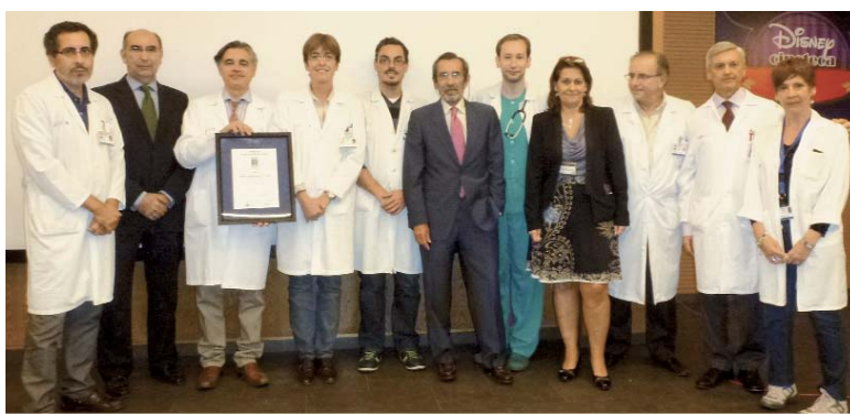
Programa de Trasplante de Pulmón