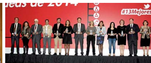
Izquierda, fotografía de grupo de la entrega de premios con motivo del 25 Aniversario de la ONT. Sobre estas líneas los ganadores del premio “Mejores Ideas” concedido por Diario Médico.