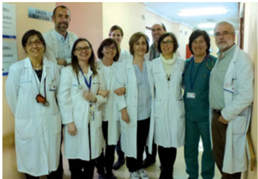
En la foto, una parte de los profesionales que participan en esta acreditación nacional.

El Hospital fue designado en el año 2010 "centro experto" para el cribado neonatal de 19 enfermedades. Los resultados de esta prueba permiten comenzar el tratamiento en los niños antes de que aparezcan los primeros síntomas y desarrollen la enfermedad, ofreciéndoles una atención integral y coordinada que cubre sus necesidades médicas, psicológicas y sociales. A partir de este análisis también es posible detectar a las madres portadoras de enfermedades metabólicas o que presentan alguna alteración que pudiera dañar al feto, permitiendo prevenir y tratarlas en el niño y la madre.