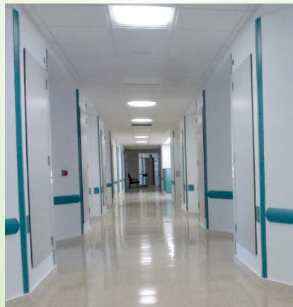
Pasillo planta 9 RG, Urología