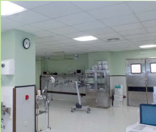
Iluminación REA 2ª planta