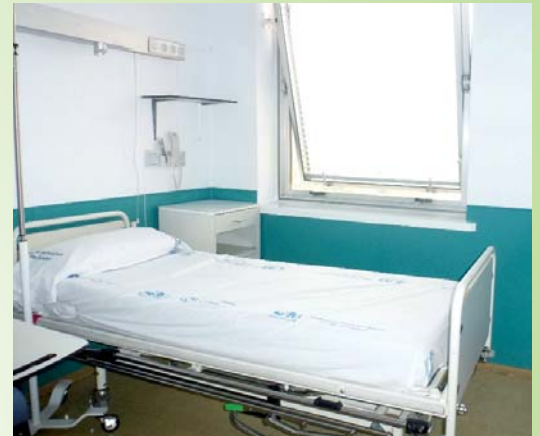
Habitación planta 14