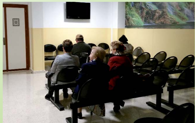
Sala de espera SPECT-TAC