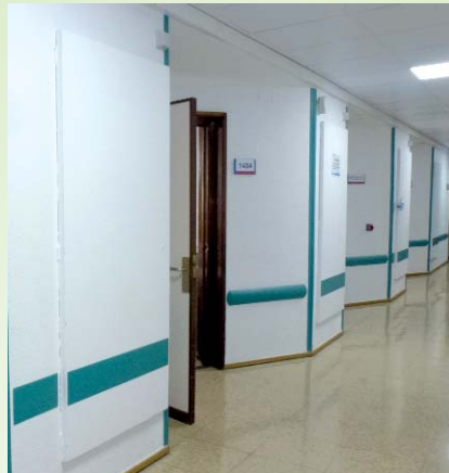
Pasillo planta 14