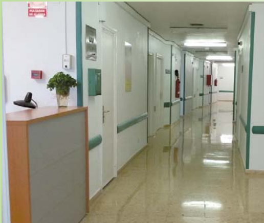
Materno-Infantil, Planta 3