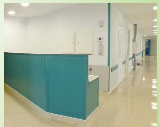
Pasillo planta 9 RG, Urología