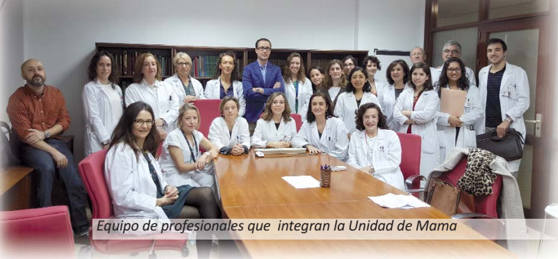
Equipo de profesionales que integran la Unidad de Mama

Esta actividad conjunta se traduce en la incorporación de novedosos procedimientos que favorecen la recuperación de la paciente. Destacan principalmente la reconstrucción inmediata de la mama en un mismo tiempo quirúrgico, incluido el pezón, o la realización de biopsia guiada por resonancia, entre otros.