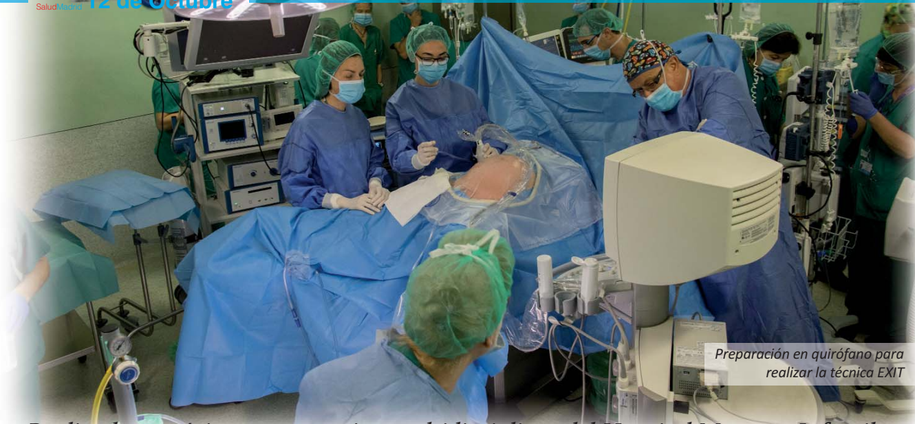
Preparación en quirófano para realizar la técnica EXIT

Realizada con éxito por un equipo multidisciplinar del Hospital Materno-Infantil