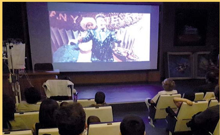
Arriba, actuación del coro All 4 Gospel Choir. Debajo, los niños disfrutando de la retransmisión de la ópera Brundibár desde el Teatro Real.

El Proyecto Hospital Sinfónico acogió dos conciertos en el mes de mayo para mejorar el bienestar de pacientes, familiares y cuidadores durante el periodo de ingreso y favorecer un ambiente más relajado y positivo entre nuestros profesionales. En concreto, se retransmitió una ópera infantil para los más pequeños y un coro de góspel amenizó la tarde del 19 de mayo a los adultos.