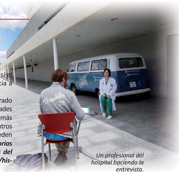
Un profesional del hospital haciendo la entrevista.

En esta experiencia han colaborado 31 hospitales públicos de 11 comunidades autónomas, siendo Madrid la región más participativa con un total de siete centros sanitarios. Nuestros profesionales pueden acceder a los videos en la página Historias de Vocación de Facebook , a través del enlace: https://www.facebook.com/historiasdevocacion/videos