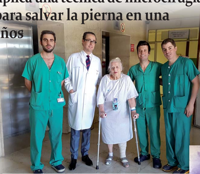
La paciente junto con los cirujanos plásticos durante un paseo por la planta de hospitalización. Derecha, radiografía completa de la pierna.

Con posterioridad, y durante su ingreso en el Hospital, Traumatología y Cirugía Plástica, en colaboración con Anestesiología