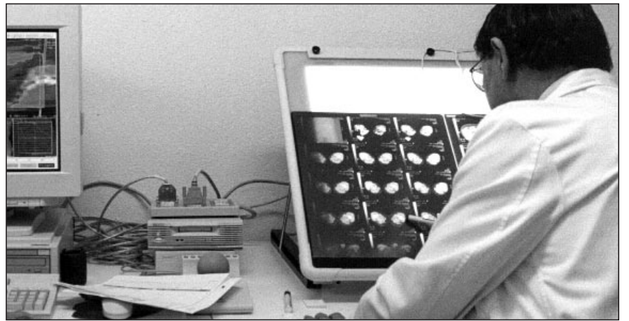
La Princesa destina más de 66 millones para su aplicación

En el Centro de Especialidades "Hermanos García Noblejas" se realizará una obra para el aislamiento acústico del aire acondicionado a fin de evitar las molestias que su ruido ocasionaba a los vecinos que habitan los inmuebles próximos del Centro. ■