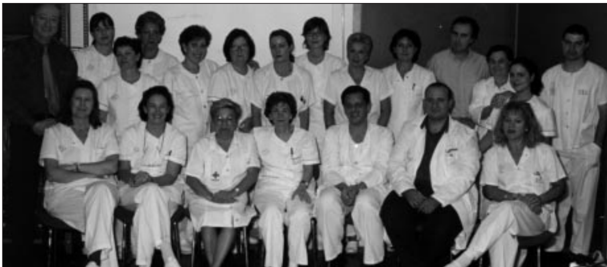
Arriba, fotografía de los miembros del Servicio de Anatomía Patológica. Derecha, imagen del laboratorio.