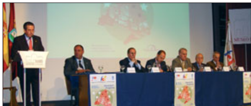
Clausura del congreso, celebrado en el salón de actos del Museo de la Ciudad.

c/ Reina Mercedes, 22 28020 MADRID Telf.: 915 539 773/915 345 895 Fax: 91 535 05 95 www.fapaginerdelosrios.org e-mail: info@fapaginerdelosrios.es