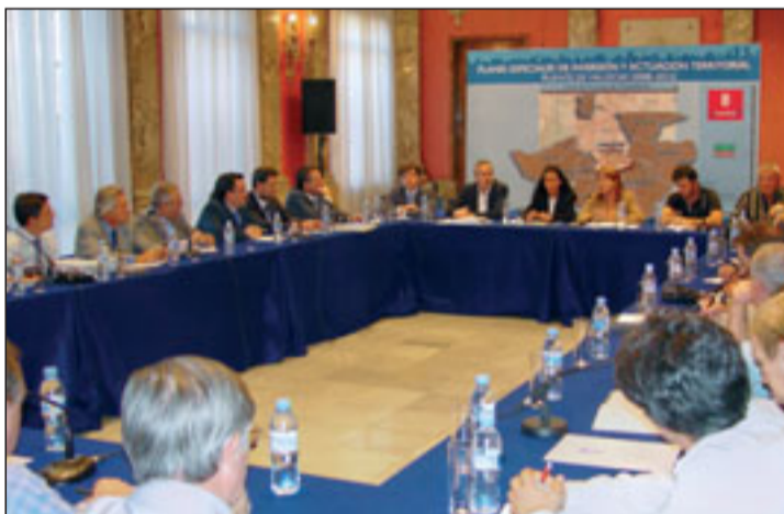
Presentación del Plan Especial en la Junta Municipal de Puente de Vallecas, a la que asistieron tres de las cuatro asociaciones de vecinos.

tritos de Latina, Carabanchel, Tetuán, San Blas y Vicálvaro, que finalizan en diciembre de 2008, y para Villaverde, cuyo Plan finaliza en 2011. Para la elaboración metodológica del proceso de concertación de los Planes Especiales de Puente y de Villa de Vallecas, el Ayuntamiento de Madrid ha suscrito un convenio de colaboración con la Universidad Rey Juan Carlos, que prestará asesoramiento científico-técnico.