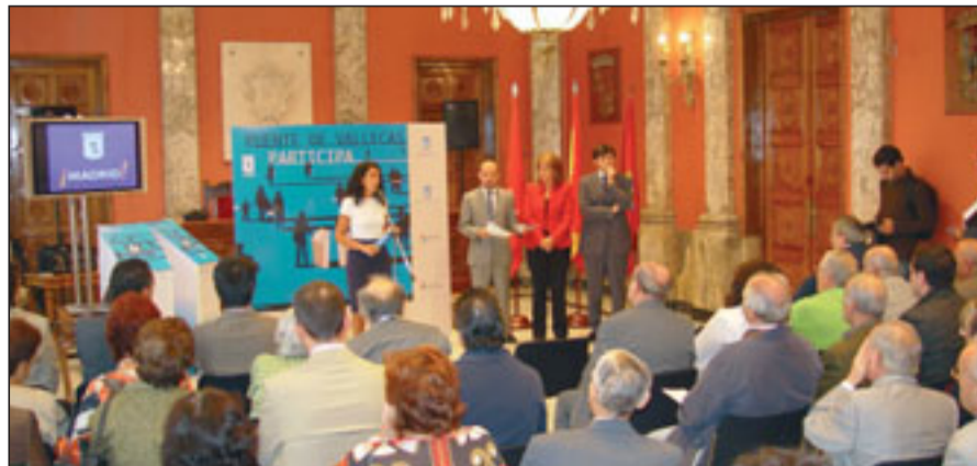
Imagen de la presentación en la Junta Municipal de Puente de Vallecas.