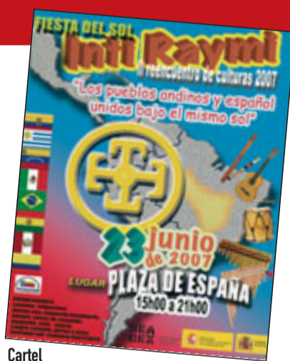
Cartel anunciador de la Fiesta del Sol.

El acto que mayor repercusión ha tenido en el proceso de consolidación de CONADEE fue la convocatoria del I Reencuentro Cultural de los Pueblos del Ecuador en España, que se celebró en los locales de la UGT el 1 de julio de 2006 (Inti Raymi 2006) con el apoyo de la Consejería de Inmigración de la Comunidad