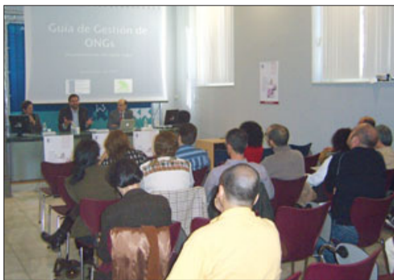
El Área Delegada de Participación Ciudadana cedió su salón de actos para la presentación de la guía.

La guía on-line trata de difundir información básica referida a gestión de entidades sin ánimo de lucro, conteniendo una recopilación completa de legislación estatal, que afecta a las entidades sin ánimo de lucro, además ofrece un servicio de consultas gratuito, sin registro, a las distintas asociaciones y fundaciones del tercer sector, respondiendo a una necesidad básica de formación e información del personal, tanto voluntario como contratado y directivo, como también profesionales más especializados; funcionarios de las administraciones y asesorías, y al público en general.