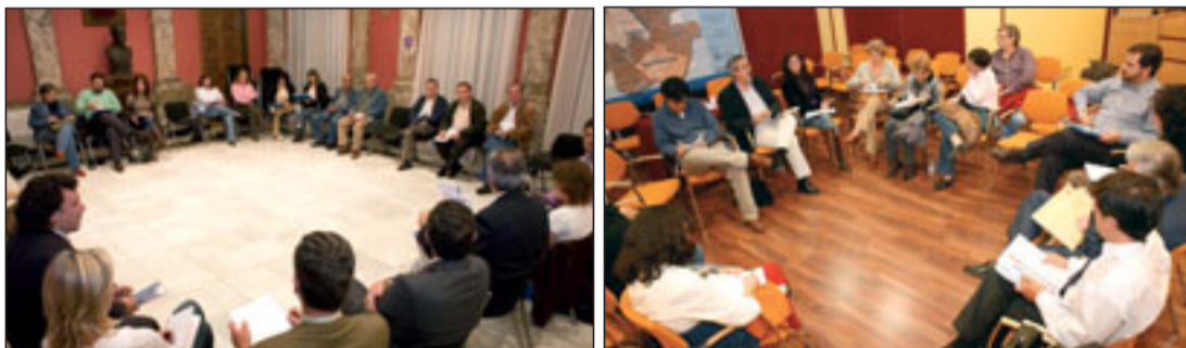
Reuniones del Foro de Asociaciones celebradas en las juntas de Puente de Vallecas (izquierda) y Villa de Vallecas.

Desde el punto de vista metodológico, el proceso de concertación de los Planes Especiales de Inversión de Villa de Vallecas y Puente de Vallecas —el de Usera aún se encuentra en una fase preliminar— arranca con el diagnóstico de las necesidades y carencias actuales de cada uno de los distritos. Para ello, se convocaron tres foros inde-