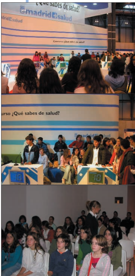
El stand de Madrid Salud fue uno de los que registró mayor número de visitas. La iniciativa del concurso “¿Qué sabes de salud?”, dirigida a escolares, constituyó todo un éxito de participación, así como la exposición por grupos de los contenidos más relevantes para la salud de los ciudadanos.

A todos los visitantes interesados se les facilitaron diferentes materiales divulgativos de los que habitualmente edita Madrid Salud para mejorar la cultura y educación sanitaria de los ciudadanos madrileños.