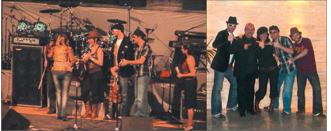
Actuación de uno de los grupos que participaron en el certamen. Derecha, los componentes del grupo posando al final del espectáculo.

El Instituto de Adicciones de Madrid Salud ha celebrado, por segundo año consecutivo, el certamen de música joven "Quédate con la Música". Esta es una iniciativa más con la que, el Gobierno de la Ciudad de Madrid, quiere estimular entre los jóvenes, un estilo de ocio atractivo, diverso y saludable alejado de aquellos que fomentan el consumo de alcohol y otras drogas.