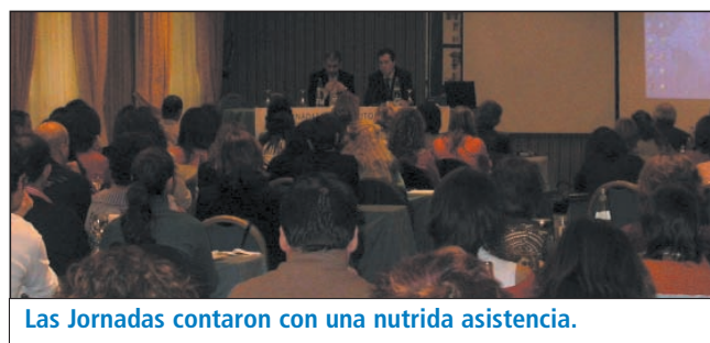
Las Jornadas contaron con una nutrida asistencia.

Las comunidades terapéuticas forman parte de los recursos de apoyo al tratamiento de la red del Instituto de Adicciones desde 1990 contando actualmente con 140 plazas distribuidas entre los diferentes programas de atención. Tienen como objetivo dotar a los pacientes en tratamiento que care-