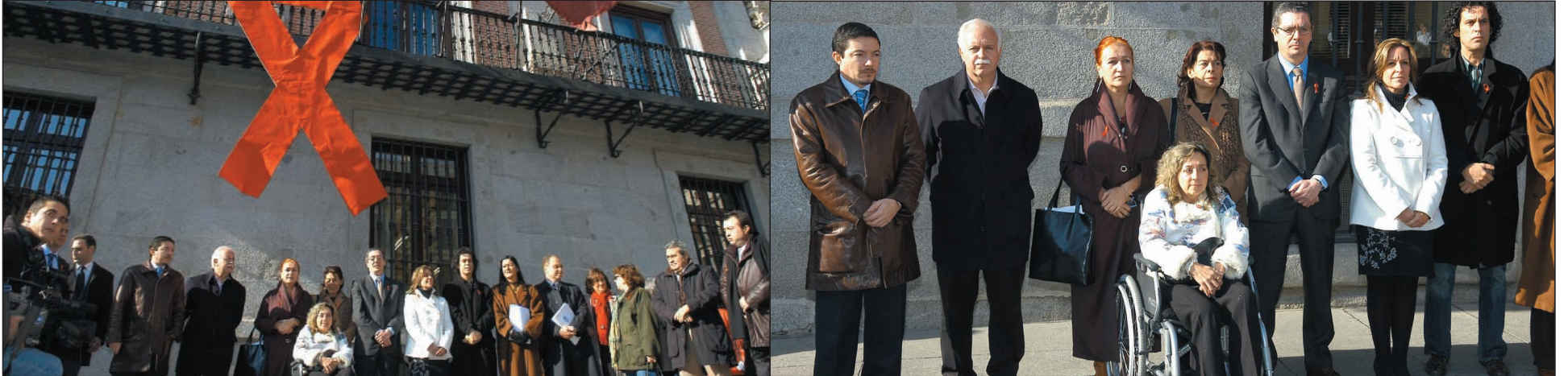
Los representantes municipales se concentraron ante la Casa de la Villa, que lucía un gran lazo rojo en solidaridad con los afectados por el SIDA, y guardaron un minuto de silencio en homenaje a las víctimas de esta enfermedad.