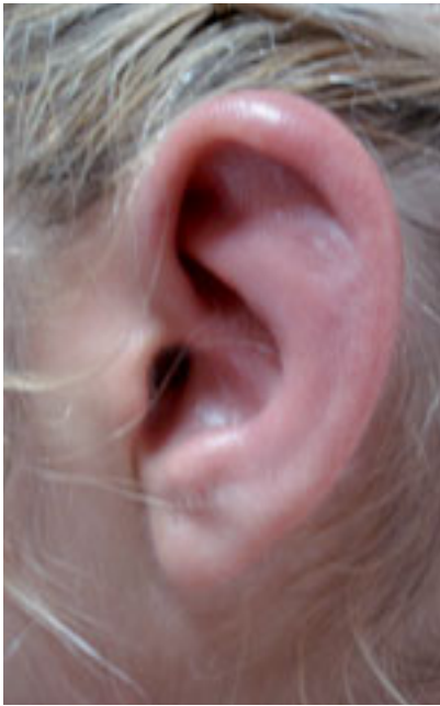
Pabellón auricular enrojecido, aumentado de tamaño y doloroso a la presión

diagnóstico y durante la evolución de la enfermedad, así como el tratamiento administrado.