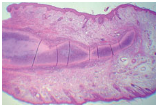
Corte transversal de la biopsia del pabellón auricular