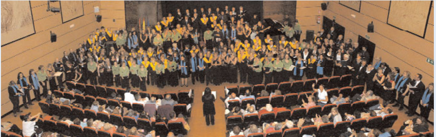
El encuentro concluyó con la actuación conjunta de las seis corales participantes que interpretaron la canción espiritual estadounidense "Oh happy day".