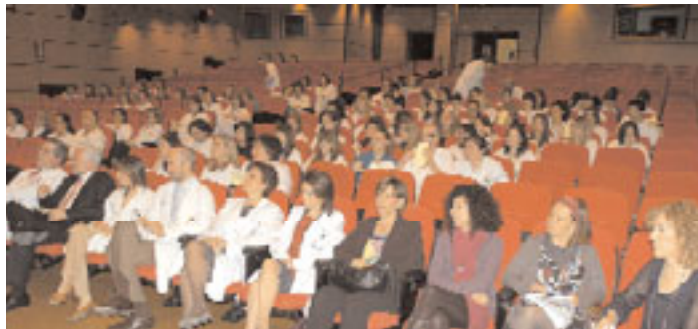
Una vista del patio de butacas del Salón de Actos durante el Día de la Enfermería.

La exposición realizada por Begoña Carbelo, nos mostró la importancia del optimismo y el buen humor en las actividades de nuestra vida, en nuestras relaciones personales y también laborales