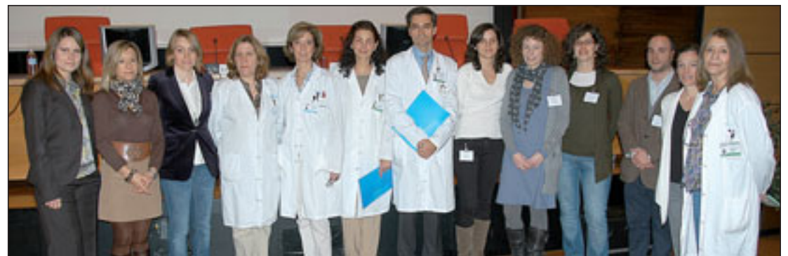
Tras la inauguración el gerente posa junto con los participantes y organizadores del programa.

El pasado 23 de febrero se celebró en el Salón de Actos la jornada "Aportaciones científicas en Enfermería" organizada por la división de Enfermería. En este acto se presentaron las 16 comunicaciones orales que los profesionales adscritos a la Dirección de Enfermería (enfermeras, fisioterapeutas, técnicos especialistas y auxiliares de enfermería) de nuestro hospital han presentado en los Congresos de sus distintas especialidades, así como 17 pósters.