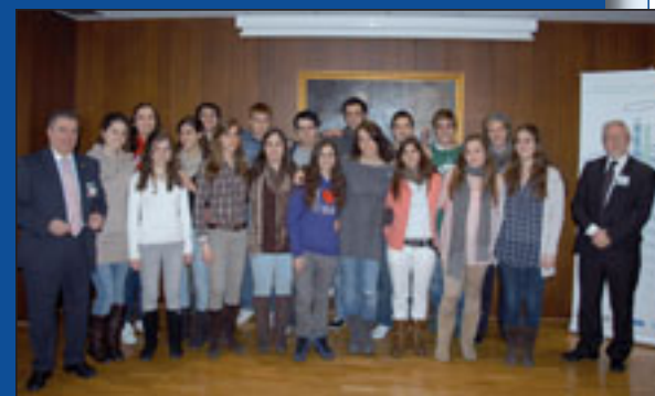
Visita de alumnos del colegio Menesiano.

El pasado 8, 9 y 15 de febrero la Subdirección de Gestión y SSGG organizó unas visitas a la cocina del hospital con los alumnos del Colegio de Formación Profesional "González Cañadas". Alumnos de 1º de Atención Sociosanitaria y de Cuidados Auxiliares de Enfermería, el objetivo de esta visita es que conocieran los procesos de una cocina hospitalaria. Son conscientes que donde termina el trabajo de hostelería comienza el de los auxiliares, por lo que está íntimamente relacionado.