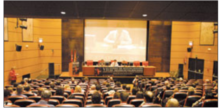
Vista del salón de actos durante la inauguración del gerente, al que acudieron más de quinientas personas.

Como es habitual se presentaron cuatro casos clínicos de forma interactiva con preguntas a la audiencia. A lo