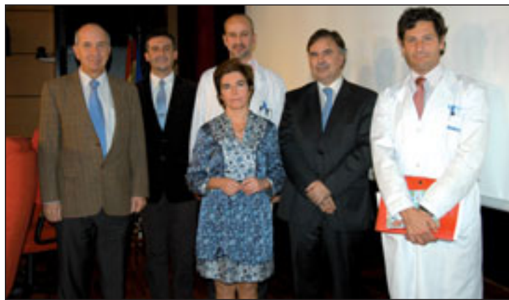
Los participantes en el curso el día de su inauguración.

Los tumores neuroendocrinos son un grupo heterogéneo de neoplasias originadas en glándulas endocrinas, islotes celulares en glándulas endocrinas y en células endocrinas dispersas entre células exocrinas, principalmente en los sistemas digestivo y respiratorio. La incidencia de estos tumores se ha incrementado notablemente en los últimos años, en parte por su mejor conocimiento y la mejor capacidad de detección de las pruebas de imagen. Su diagnóstico y tratamiento son en ocasiones de alta complejidad y requieren una gran pericia de los especialistas implicados. En muchos casos es necesario un abordaje multidisciplinar de los pro-