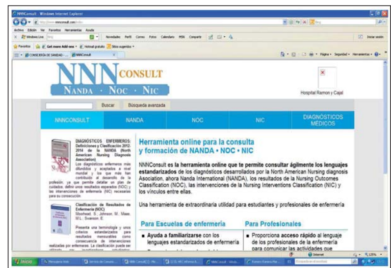
Pantalla inicial de acceso a la aplicación NNN Consult

La Dirección de Enfermería ha presentado una nueva herramienta on line -NNN Consult- disponible dentro de las Aplicaciones Web de la Intranet que permite una consulta ágil del lenguaje estandarizado NANDA-NOC-NIC. Este recurso será de gran ayuda para continuar prestando un cuidado individualizado, humanitario e integral con el objetivo final de capacitar a nuestros pacientes para el autocuidado. Los Planes de Cuidados en Enfermería suponen una herramienta muy útil para los profesionales de Enfermería, aportando una mejor comunicación con los pacientes y entre los propios profesionales, ya que al unir criterios y terminologías comunes, se favorece la continuidad de los cuidados, se fomenta la formación para el desarrollo profesional y se facilita la aplicación del Proceso Enfermero en su aplicación y registro.