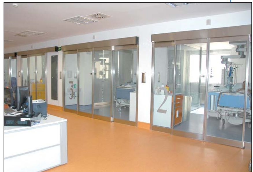
Diferentes panorámicas de las nuevas instalaciones de la Unidad Coronaria, situada en la 2ª izquierda

La Unidad Coronaria, perteneciente al Servicio de Cardiología, ha sido renovada completamente, primando la funcionalidad y comodidad de los pacientes, profesionales y familiares. La obra, que se enmarca dentro del plan de obras de mejora y renovación de nuestro hospital, ha supuesto el traslado de esta unidad a la planta 2ª izquierda control C (antigua UVI pediátrica), al igual que varios despachos del Servicio de Cardiología, entre ellos el del Jefe de