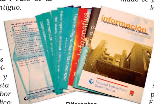
Diferentes materiales informativos editados por el Hospital en 2003

En definitiva, apostar por una mejor información es beneficioso para todos.