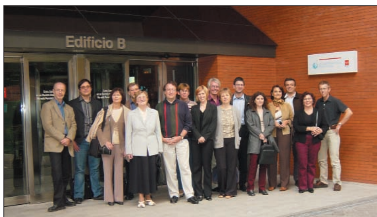
Los participantes posaron como recuerdo en la entrada del edificio de consultas del Hospital.

Este proyecto está financiado por la Comisión Europea dentro del V programa Marco de Investigación en el programa Calidad de Vida. La duración del proyecto es de tres años y su objetivo es el desarrollo de una herramienta o grupo de herramientas para la evaluación de la calidad y la eficiencia de la prestación de