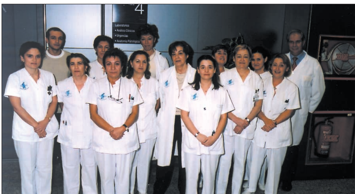
Fotografía de los profesionales que trabajan en el Servicio de Análisis Clínicos.

con la asistencia materno-neonatal, "atendemos unos 3.000 partos al año, lo que supone proporcionar diagnóstico durante el embarazo, durante el parto, además de la atención a los recién nacidos". Como el hospital Santa Cristina se abrió hace unos años a otras especialidades, ha crecido la demanda de