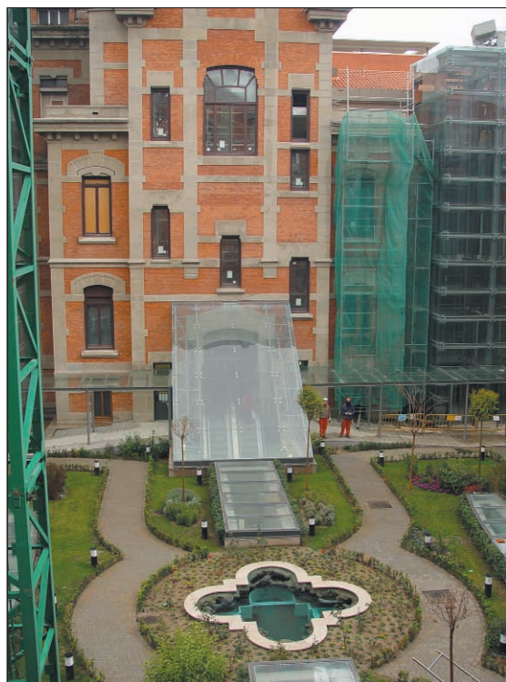
Sobre estas líneas algunas imágenes de las obras en curso. Derecha, de arriba a abajo, las nuevas instalaciones de aire acondicionado situadas bajo la cubierta; sala de Reanimación e imagen de uno de los pasillos

Ya a pleno rendimiento el nuevo edificio de consultas, cuyas obras finalizaron en octubre de 2001, avanza a buen ritmo la remodelación del antiguo edificio. La I Fase, que afecta a la mitad de la superficie, está prevista que finalice en la próxima primavera. Así, estarán operativos la central de esterilización, quirofanos, guardia medica y algunas habitaciones de hospitalización. Un moderno hospital instalado en el edificio clásico de la antigua maternidad.